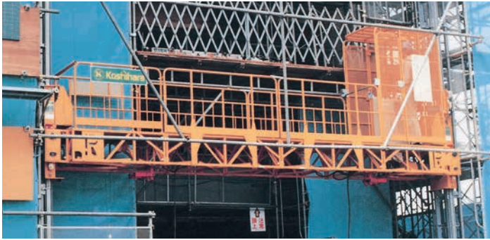
ロングスパンエレベーター