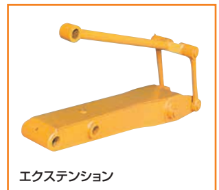
エクステンション