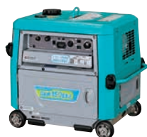
ガソリンウエルダー