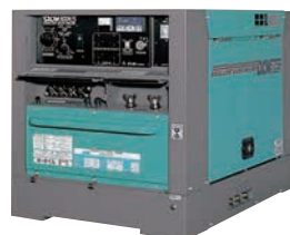
二人用ウエルダー