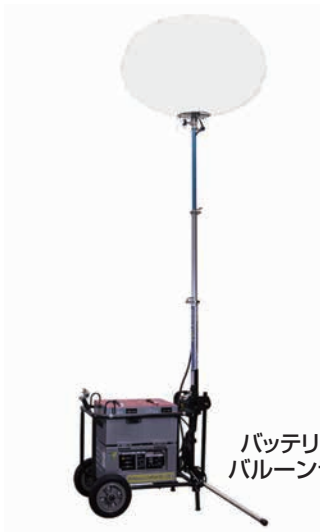
バッテリー式 バルーンライト