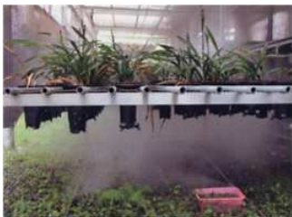
フラワーショップで