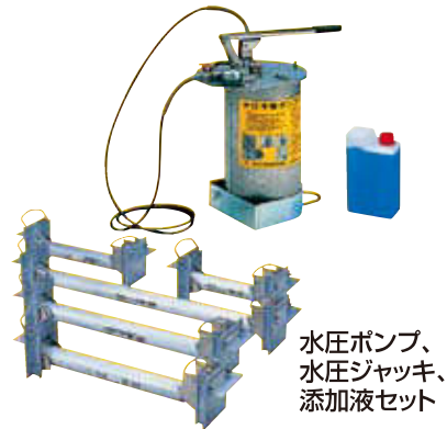
水圧ポンプ、 水圧ジャッキ、 添加液セット