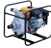
2インチ エンジンポンプ